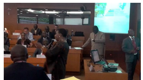
SEMme. L'Ambassadeur de CI à l'Espagne. IESE Barcelone, Juillet 2012. Séance de travail des entrepreneurs ivoiriens et HK.