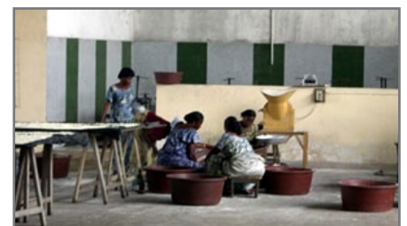
COVAPCI, Coopérative de Vendeuses d'Attieké et Poissons de Côte d'Ivoire, 2012.